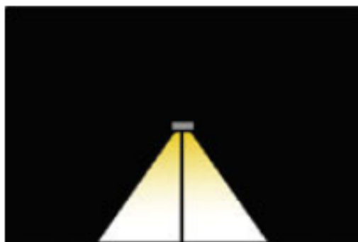
Type 6 360 °