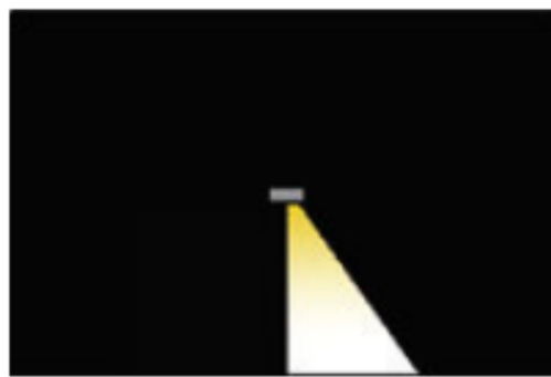
Type 6 180 °